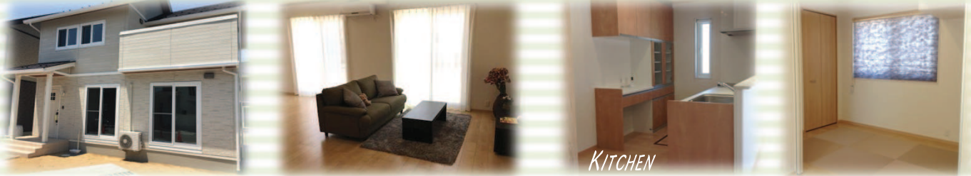
写真は実際の建物です(2017年5月撮影)